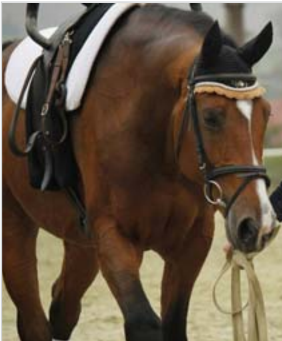
Nejúspěšnější voltažní kůň posledních let LANDAR dělá čest i plemeni ČT

Pokud sledujete různé články, píše se vždy jen o konečném umístění, chybách, bodování apod. Jsme velmi rádi, že se voltaž dostává pomalu, ale jistě do povědomí širší veřejnosti. Je dobré si uvědomit, co, kdo a kolik práce za těmito výsledky stojí – i o tom by se mělo psát.