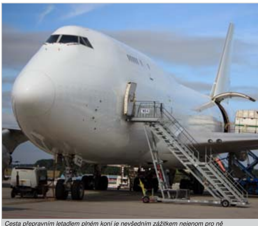
Cesta přepravním letadlem plným koní je nevšedním zážitkem nejenom pro ně

Zlato a stříbro si z Ria odvezl rakouský reprezentant Pepo Puch, který byl v letech 1987 až 2008 reprezentanem Rakouska a později Chorvatska ve všestrannosti. V těchto letech byl velmi častým jezdcem i u nás pořádaných soutěžích. V roce 2008 utrpěl po pádu při soutěži CNC3* Schenefeldu zranění, po kterém částečně ochrnul. Po stabilizaci jeho zdravotního stavu začala jeho paradrezurní kariéra ve skupině handicapu 1B. Již v Londýně získal pro Rakousko zlato a bronz a na úspěchy navázal i v Riu.