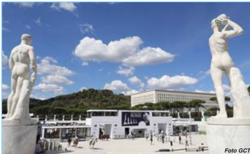
Kolbiště pro GCT v Římě