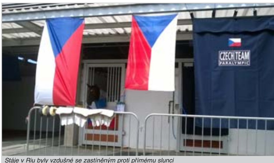
Stáje v Riu byly vzdušně se zastíněným proti přímému slunci

AV: „Po účastech na ME a MS byly paralympijské hry dalším úžasným zážitkem. Fascinovala mě atmosféra her, vstřícnost všech organizátorů a diváků. Zaplněné tribuny plně respektovaly pokyny pořadatelů. Např. se nestalo,