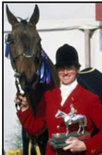
V Británii zemřel 8. ledna ve věku 76 let trojnásobný olympijský vítěz ve všestrannosti Richard Meade .