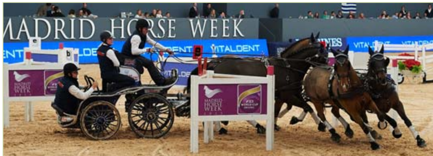
První dvě kvalifikace SP spřežení ovládl Australan Boyd Exell, který zvítězil jak ve Stuttgartu, tak v Madridu

Další kolo FEI Reem Acra Dressage World Cup se konat v Salzburgu v neděli 6. prosince. Kompletní výsledky na www.swedenhorshow.se