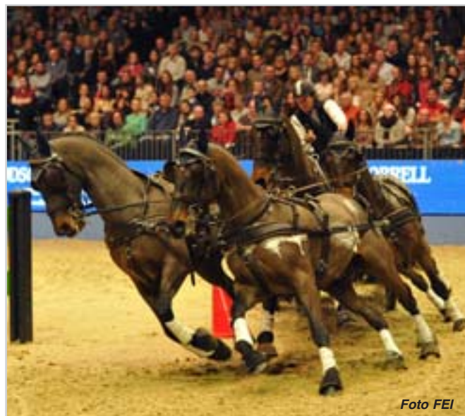
V Londýně i Mechelenu pokračoval 5. a 6. kolem také Světový pohár spřežení. V Olympia Hall zvítězil za Austrálii startující Boyd Exell (vlevo) a v Mechelenu Holanďan Koos de Ronde. Na čele průběžného pořadí je nyní před závěrečnými závody v Lipsku a Bordeaux Boyd Exell.