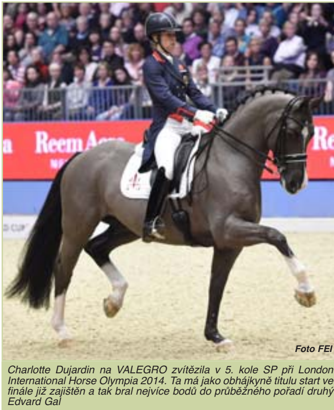
Charlotte Dujardin na VALEGRO zvítězila v 5. kole SP při London International Horse Olympia 2014. Ta má jako obhájkyně titulu start ve finále již zajištěn a tak bral nejvíce bodů do průběžného pořadí druhý Edvard Gal

Příští kolo Světového poháru bude v sobotu 31. ledna 2015 v Amsterdamu.