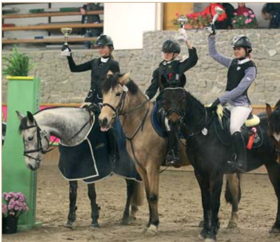
Ilustrační foto z roku 2013

Tento týden pak v Herouticích přivítají chovatele Českého teplokrevníka, pro které zde Svaz chovatelů ČT připravil osmý ročník předvýběru hřebců . Mladí hřebci (nar. 2012) přijdou na řadu v pátek (14. listopadu) odpoledne, starší (výběr do PKH ČT) pak v sobotu od 9.30 hodin.