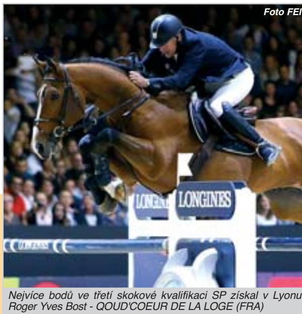
Nejvíce bodů ve třetí skokové kvalifikaci SP získal v Lyonu Roger Yves Bost - QUOD'COEUR DE LA LOGE (FRA)

Po něm se na kolbišti objevil bouřlivě povzbuzovaný domácí mistr Evropy Roger Yves Bost s 10letou hnědkou QUOD'COEUR DE LA LOGE