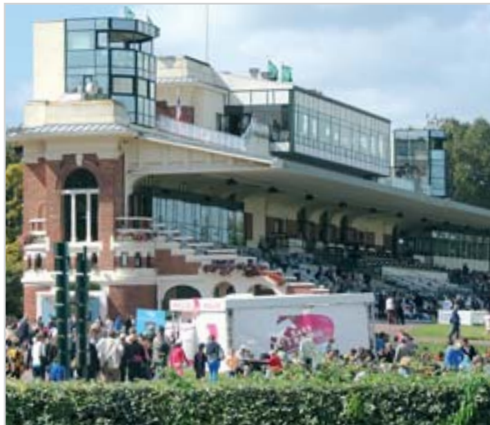
Závodistiště v Deauville