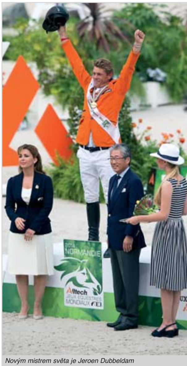
Novým mistrem světa je Jeroen Dubbeldam