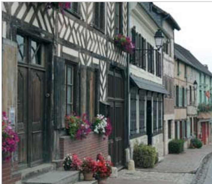
Jedna z překrásných vesnic normandského venkova