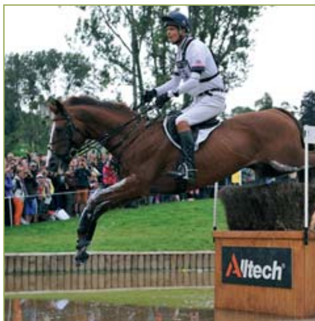
V Normandii se William Fox-Pitt musel spokojit s bronzovou medailí. O týden později, kdy SJH vrcholily se po 4. místě při CCI4* v Burghley, vyhoupl na čelo seriálu FEI Classics 2013/2014. V Burghley zvítězil Andrew Nicholson (AVABURY). Kompletní výsledky na www.burghley-horse.co.uk

V družstvech vedlo Německo před Novým Zélandem a USA. Terénní zkouška byla podle očekávání náročná a navíc dlouhodobými dešti nasáklý terén ji ještě ztížil. Časový limit byl velmi neúprosný a nikomu se nepodařilo ho dodržet. Z vedoucích jezdců průběžného pořadí byl nejrychlejší William Fox-Pitt, který získal na druhou Sandru Auffarth dvoubodový náskok. Na třetí příčku se dostal Michael Jung a na čtvrtou poskočila nejrychlejším crossem Jonelle Price z Nového Zélandu, s 11letou vrankou CLASSIC