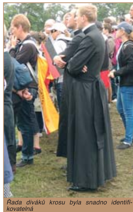
Řada diváků krosu byla snadno identifikovatelná