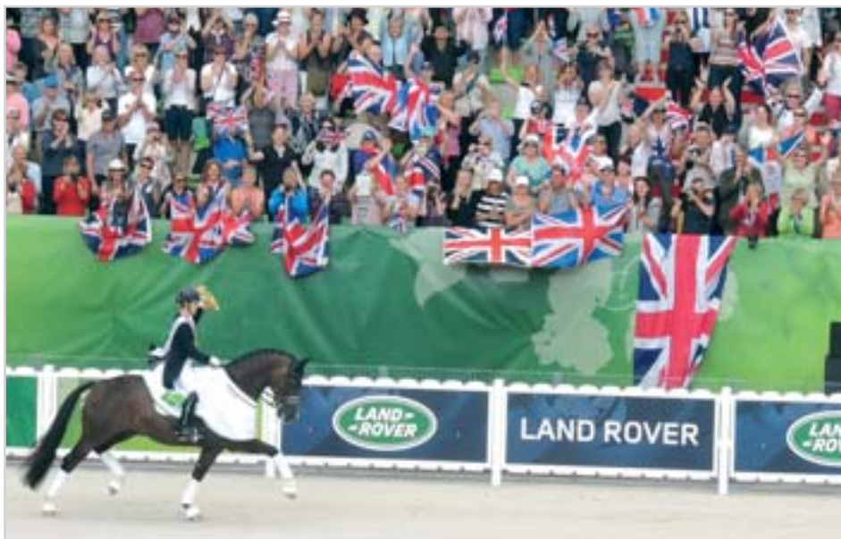
Charlotte Dujardin, VALEGRO a britská radost

V sobotu našťástí neprší. Cesta do národního hřebčína Normandie je nádherná. Silničky, silnice ale často i dálnice lemují neprodyšně mnohametrové živé ploty, za kterými lze tušit a někdy i zahlédnout pastviny plné ovcí, krav nebo koní. Ve většině městeček, kterými projíždíme, by