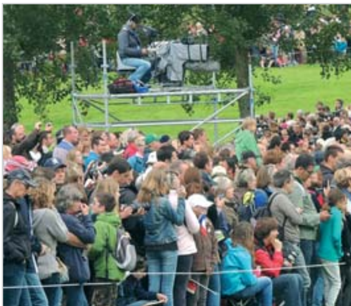
Na kros v Haras du Pin dorazilo 40 000 diváků