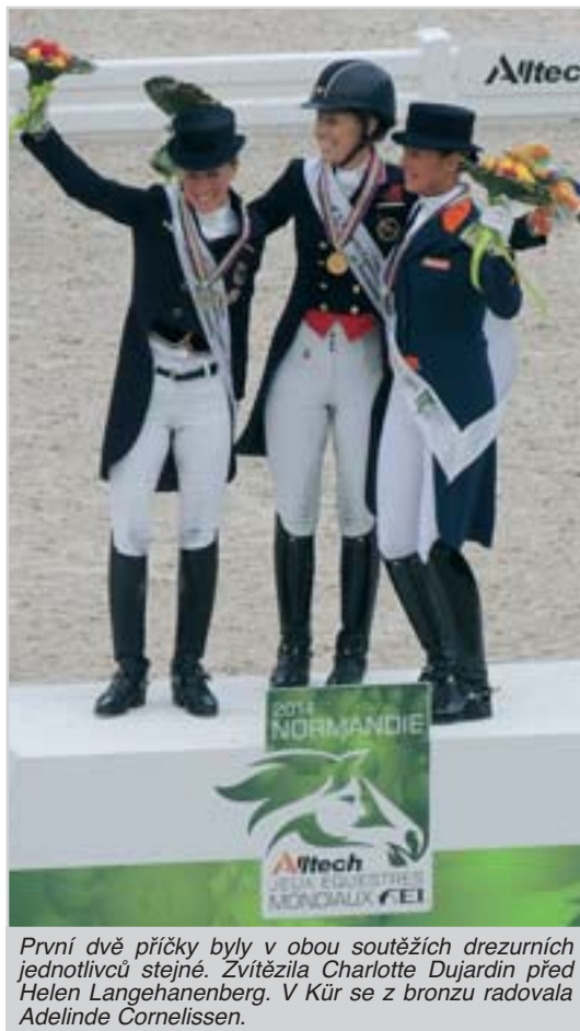
První dvě příčky byly v obou soutěžích drezurních jednotlivců stejné. Zvítězila Charlotte Dujardin před Helen Langehanenberg. V Kür se z bronzu radovala Adelinde Cornelissen.