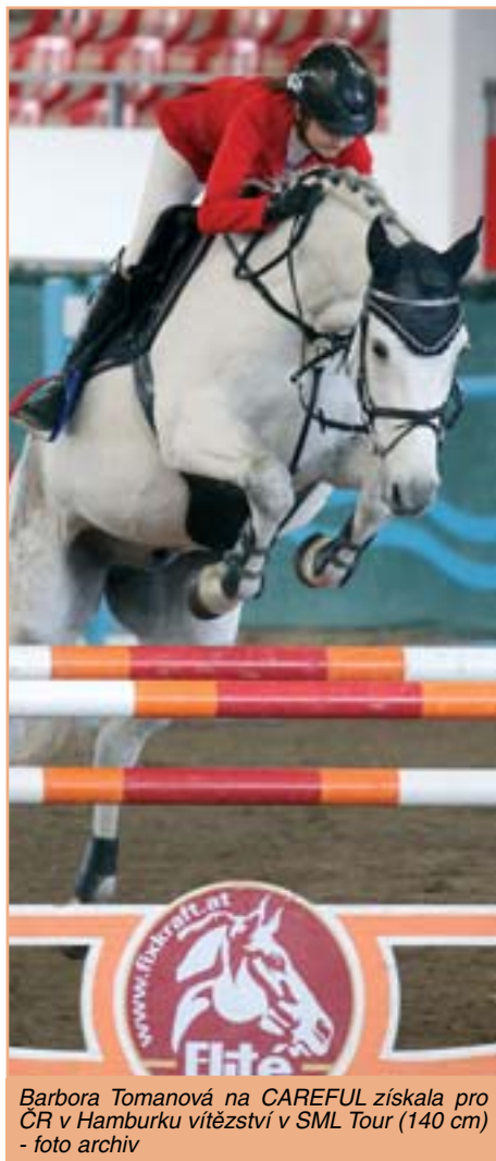
Barbora Tomanová na CAREFUL získala pro ČR v Hamburku vítězství v SML Tour (140 cm)

Z jezdců, kteří dokázali parkur dokončit, jich patnáct dosáhlo dvouciferného výsledku. Diváci ale letos marně čekali, zda se někomu podaří zaznamenat historickou sto čtyřicátou osmou nulu.