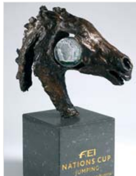
Trofej pro vítěze Furusiyya FEI Nations Cup

Tento pátek se již rozbíhá i evropská divize 1, bývalá Superliga. V pátek 17. května je na programu PN v La Baule a o týden později se bude o Furusiyya body bojovat v Římě.