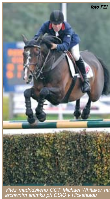
Vítěz madridského GCT Michael Whitaker na archivním snímku při CSIO v Hicksteadu