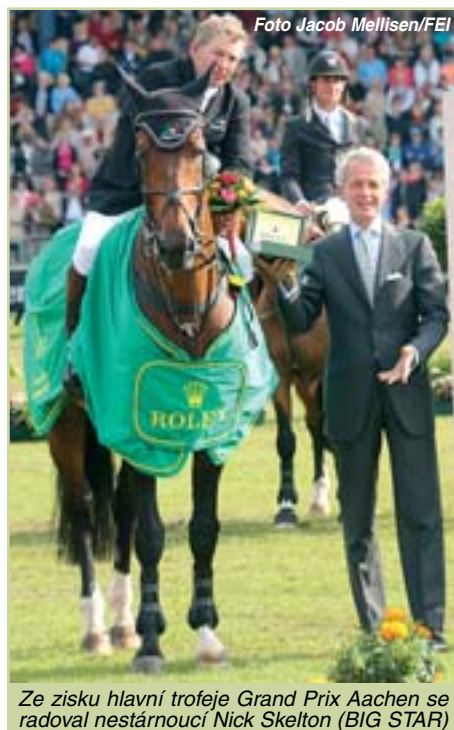
Ze zisku hlavní trofeje Grand Prix Aachen se radoval nestárnoucí Nick Skelton (BIG STAR)