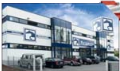
MEGA STORE Vídeň A23 Richard Strauss Straße 6, 1230 Wien-Neubau Rakousko

Výhled: Flughafen Langarts - výhled tramvají Směr: Großglocknerstraße, McDonald's Výhled: Waverlanger Allee Směr: Amalienburg a MEGA STORE