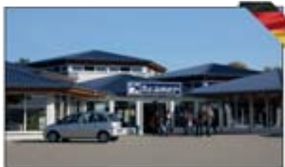
MEGA STORE Norimberk A1 Čáslavská 1022, An Holan 8222 1 Hájemská pláze Nürnberg-Fürth (Toscan-fry americká kafe) 90475 Norimberk, Německo

15 000 druhů zboží • Prodejní plocha 1 300 m 2 • 15 odborných poradkyň a poradců