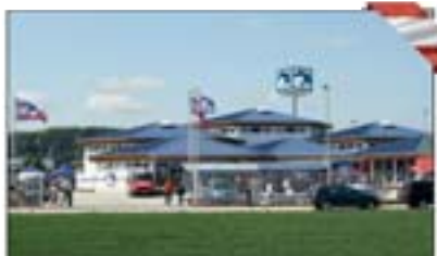
MEGA STORE Linz A1/91 Lagerstraße 3, 4041 Linz Rakousko