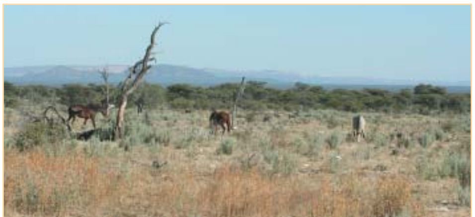
Výběh 80 km 2