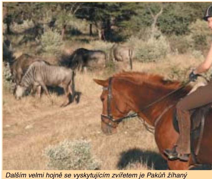
Dalším velmi hojně se vyskytujícím zvířetem je Pakůň žíhaný

Po samotném vjezdu do rezervace zastavujeme na každém kroku. Důvodem zastávky je antilopa u silnice, v dále zahlédnutá žirafa či nebojácné Mangusty žíhané. Postupně ale začínáme důvody k zastavení třídit a hledáme zvířata, kvůli kterým většina návštěvníků do safari přijíždí. Zajímá nás zda budeme mít štěstí a spatříme často se skrývající lvy či stáda slonů. Tentokrát stálo na naší straně. Několik králů zvířat, včetně dovádějících lvíčat, jsme zahlédli v posledních minutách, po kterých zmizeli v hloubce buše. A o několik chvil později nám svoji přítomnost věnovalo snad padesátihlavé stádo slonů. To bylo sice zpočátku zcela ukryté