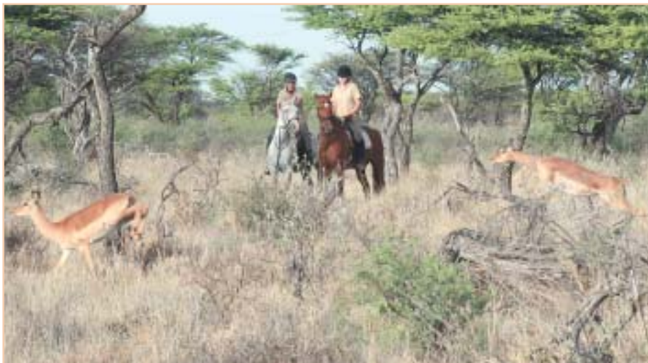
V Kambaku Safari Lodge jsou antilopy impaly jedněmi z nejčastějších zvířat