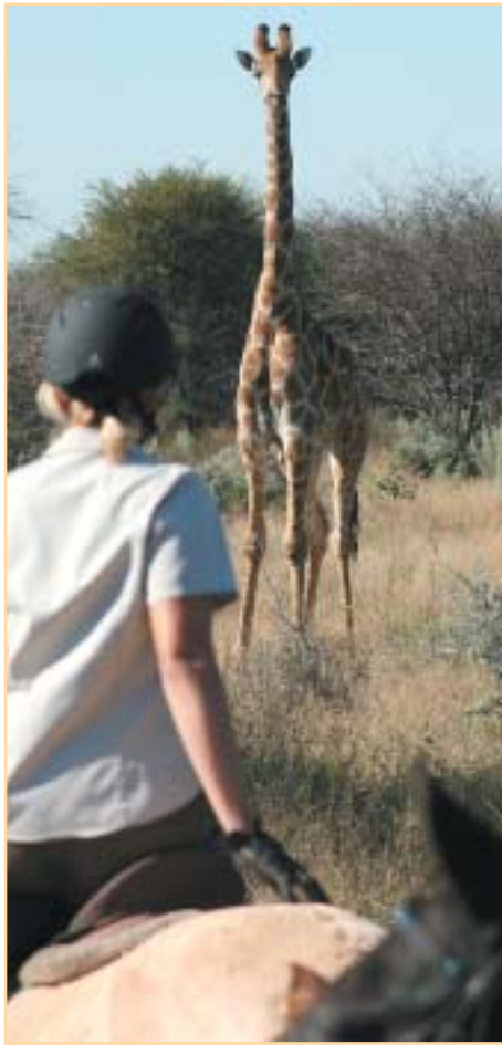
Setkání s žirafou patřilo k těm najatraktivnějším

Centrální část rezervace vyplňuje obrovská pánev (Etoscha Pan, 4731 km 2 ), která se v období dešťů plní vodou. Toto malé moře pak, než