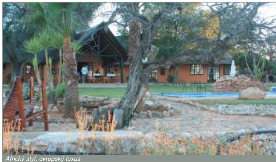
Africký styl, evropský luxus

detajně seznámit s rostlinami, které tvoří namíbijskou buš.