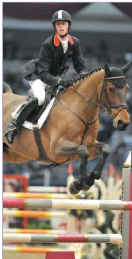
Brit Ben Maher zvítězil na TRIPPLE XIII ve druhém kole Global Champions Tour ve Valencii. Na archivním fotu při SP v londýnské Olympia Hall v sedle ROBIN HOOD.

stavila 11letou hnědku NAYANA (Royal Feu). Jízda se jí však nepovedla a shodila dva skoky. Mnohem lepší dojem zanechal britský veterán Michael Whitaker s poněkud obtížně jezditelným hnědákem VIKING (Jacomar). Projel trasou ve svižném tempu, bez chyby a v čase 42,17 sec. O vedení v soutěži ho však hned připravil jeho týmový kolega Ben Maher se svým vlastním odchovancem TRIPPLE X III (Namelus R). Po riskantní jízdě se mu časomíra zastavila na 41,35. Ještě rychlejší byl irský reprezentant Denis Lynch s 12letým ABBERVAIL VAN HET DINGESHOF (Nonstop), bylo to však jen za cenu jednoho shození. O vítězství se pokusil i známý Brazilec Alvaro de Miranda s hnědákem AD