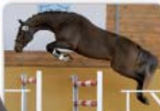
Casman Cascari x Stockholm Hnědák, nar. 2006, HOLST, KVH 165