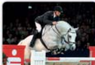
Carpalo Carpaccio x Bodevik Hnědák, nar. 1998, HOLST, KVH 175