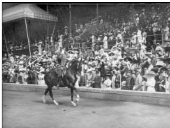
Švéd Carl Bonde na koni EMPEROR se stal historicky prvním jezdeckým vítězem novodobých OH, když ve Stockholmu v roce 1912 získal zlatou medaili v drezuře

Revize programu OH je trvalou součástí vývoje olympijského hnutí a zdá se, že momentálně není jezdecký sport v rámci OH ohrožen. Princezna Haya přímo uvedla: „Ochrana jezdeckého sportu v rámci olympijského hnutí je pro FEI velmi důležitá a moje role jako člena MOV mi poskytuje dobrou příležitost k podpoře jezdeckví i v budoucnosti. 100 let na OH bude důkazem vývoje jezdeckví a za všechny jezdce věřím v dalších 100 let jezdeckého sportu na olympijských hrách.“