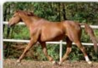
Dormane du Puy Double Esprit x Grand Veneur Kobalík, nar. 1991, ST, KVH 169