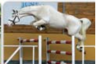
Diamante Tolliver Decanter x Sovereign Prince Nepř. bílý, nar. 2009, CS, KVH 167