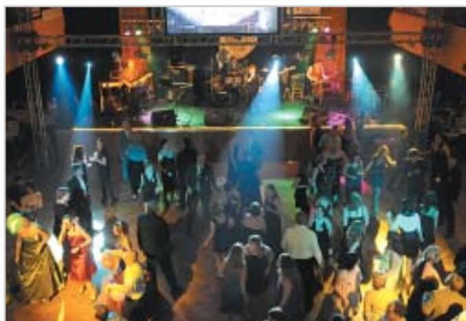
Plesová zábava v Kolíně

V rámci plesu byla vyhodnocena anketa portálu jezdci.cz o nejlepšího pořadatele. Mezi třemi fina-