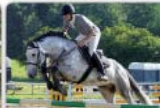
Crox Carthago 2 x Cassini II Bílý, nar. 2007, HOLST, KVH 168