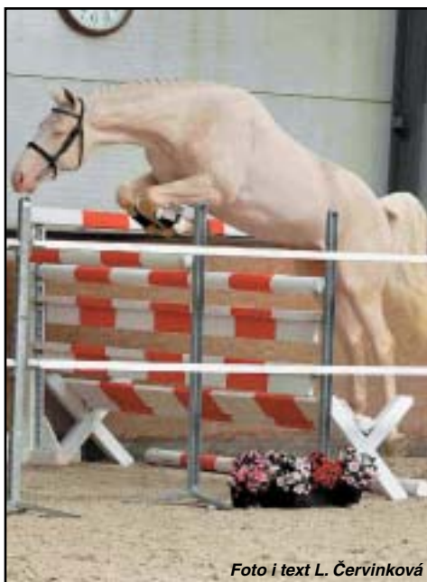
foto nahoře holštýnský hřebec CARPALO (Carpaccio x Roderik), zapůjčený z německého hřebčince Moritzburg

V sobotu 25. února se v Mněticích konal první letošní předváděcí den plemenných hřebců. Kolektiv pracovníků inseminační stanice Mnětice předvedl kolekci plemenných hřebců, zástupce několika plemenných knih od ČT a CS, přes krev SF, holštýnské hřebce i zástupce KWPN. Novinkou byl představitel britského sportovního koně a závěrem celé akce se předvedli i starokladubský bělouš, hafling nebo slezský norik. Celá akce proběhla v areálu inseminační stanice ERC Mnětice. Druhý předváděcí den se kona 11. března od 12.00 hodin.