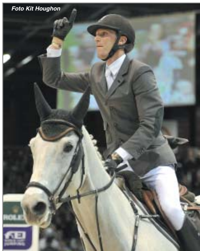
Vítězem kvalifikace pro Světového poháru v Bordeaux se stal Kevin Staut na SILVANA HDC