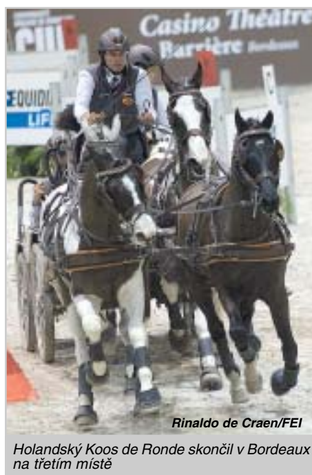
Rinaldo de Craen/FEI

Boyd Exell při svém čtvrtém finálovém triumfu v Bordeaux