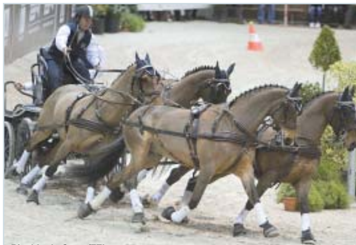
Rinaldo de Craen/FEI

Kvalifikace Světového poháru finišují a me-