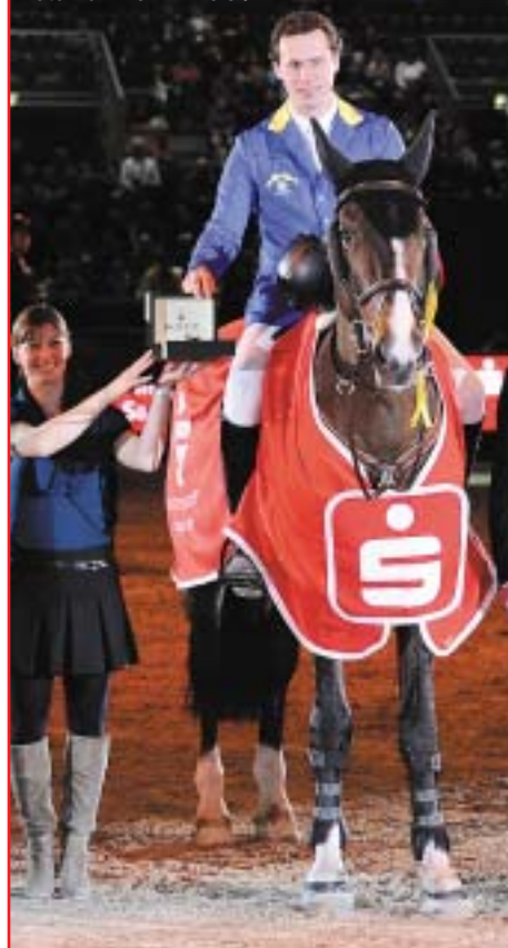
Další hodinky do Ahlmannovy sbírky