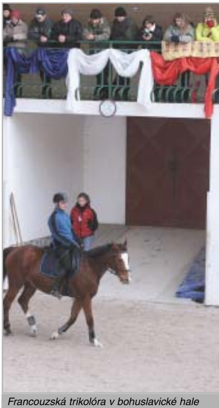
Francouzská trikolóra v bohuslavické hale

Podrobná pravidla Českého drezurního poháru vč. termínových listin naleznete na www.drezura-cjf.cz