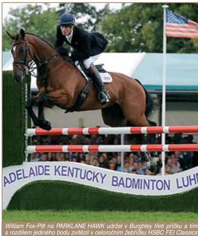
William Fox-Pitt na PARKLANE HAWK udržel v Burghley třetí příčku a tím s rozdílem jediného bodu zvítězil v celoročním žebříčku HSBC FEI Classics

The Land Rover Burghley Horse Trials 2012: 1. Andrew Nicholson - AVEBURY (NZL) 41.0 + 0.8 + 4 = 45.8, 2. Sinead Halpin - MANOIR DE CARNEVILLE (USA) 36.3 + 0.0 + 12 = 48.3, 3. William Fox-Pitt - PARKLANE HAWK (GBR) 41.0 + 2.4 + 8 = 51.4, 4. Oliver Townend - ARMADA (GBR) 43.5 + 0.0 + 8 = 51.5, 5. Jonathan Paget - CLIFTON LUSH (NZL) 46.2 + 2.0 + 4 = 52.2, 6. Allison Springer - ARTUR (USA) 40.0 + 9.2 + 8 = 57.2, 7. Izzy Taylor - BRIARLANDS MATILDA (GBR) 50.5 + 6.8 + 4 = 61.3, 8. Kai Ruder - LEPRINCE DES BOIS (GER) 41.0 + 17.2 + 4 = 57.2, 9. Sam Griffiths - HAPPY TIMES(AUS) 42.0 + 4.4 + 16 = 63.0, 10. Bettina Hoy - LANFRANCO TSF (GER) 49.0 + 14.0 + 0 = 63.0