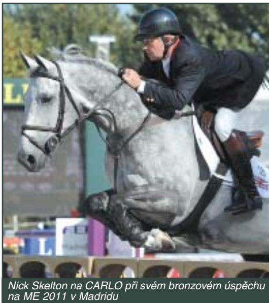
Nick Skelton na CARLO při svém bronzovém úspěchu na ME 2011 v Madridu

Kurz druhého kola byl ještě náročnější a jenom šest jezdců dokázalo na tomto parkuru nechybovat.