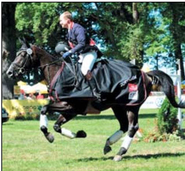
Podají se Michaelu Jungovi v letošním Světovém poháru hattrick