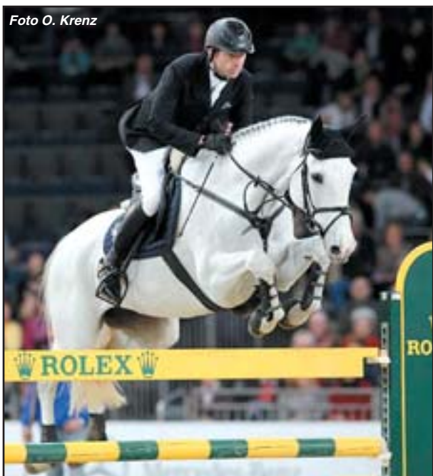
Vítězství ve Stuttgartu získal Carsten-Otto Nagel na CORRADINA. Letošní statistiku tak obohatil již čtvrtým vítězstvím pro Německo z pěti dosud odjetých kvalifikací Světového poháru.

Kurz nedělní Velké ceny, pátého kola Světového poháru, byl hodně náročný s několika technickými pasážemi. Ze čtyřiceti jezdců se třinácti podařilo překonat základní parkur bez chyby. Nebyl mezi nimi Philippe Le Jeune, který ještě nechává svého skvělého VIGO D'ARSOUILLES odpočívat a s 9letou BOYANTE DE MUZE inkasoval pět bodů. Chyby udělali i další skvělí jezdci, jako Marko Kutscher, Ludger Beerbaum, Denis Lynch, Olivier Guillion, Jessica Kürten, Kevin Staut, Lauren Hough nebo Christian Ahlmann. Meredith Michaels-Berberbaum v sedle CHECKMATE po chybách raději vzdala.