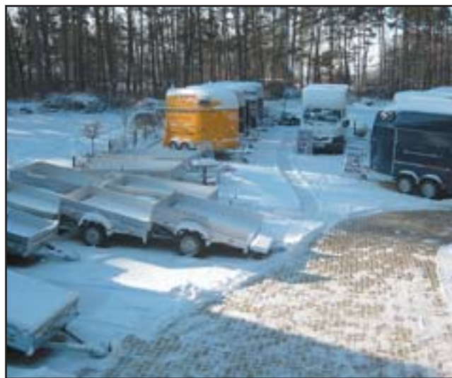
I v Chloumku jsou nyní zapadání sněhem