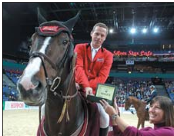
Christian Ahlmann s TALOUBET Z zvítězil ve druhém kole západoevropské ligy Světového poháru v Helsinkách