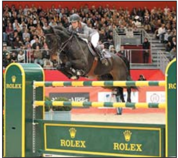
Meredith Michaels-Beerbaum na CHECKMATE zvítězila ve Světovém poháru v Lyonu

Pořadí Západoevropské ligy po třech kolech: 1. Christian Ahlmann GER - 40, 2. Kevin Staut FRA - 32, 3. Leon Thijssen NED - 27, 4. Philipp Weishaupt GER - 24, 5. Malin Baryard-Johnsson SWE - 23, 6. Lars Nieberg GER - 22, 7. Meredith Michaels-Beerbaum GER a Rodrigo Pessoa BRA - 20, 9. Julien Epailard FRA - 18, 10. Gerco Schroder NED a Ludger Beerbaum GER - 17, 12. Ludo Philippaerts BEL, Rene Lopez COL - 15, 14. Karina Rie Truelsen DEN, Marco Kutscher GER a Nina Fagerstrom FIN - 13, 17. Rolf-Goran Bengtsson SWE - 12, 18. Wout-Jan Van der Schans NED 11, 19. Jessica Kürten IRL a Jos Lansink BEL - 10.