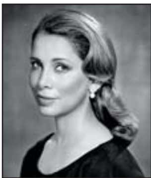
Důležitým kandidátem je současná prezidentka FEI, jordánská Princezna Haya Al Hussein

Volba nového prezidenta proběhla na Thajvanu v pátek po 16.00 hodině. Vzhledem k časovému posunu se jedná o časně páteční dopoledne středoevropského času. Kdo je tedy novým prezidentem FEI si již můžete v této chvíli zjistit na www.horsesport.org