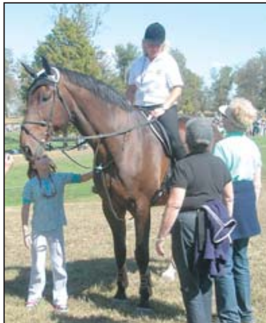
CAPITANO se prošel i po trati mistrovské všestrannosti

Získali jsme spoustu důležitých kontaktů, byla to velká zkušenost a určitě nelituji toho, jaké úsilí a peníze nás toto vše stálo. Můžu nyní