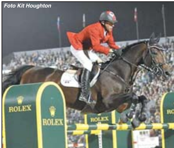
Erich Lamaze - HICKSTEAD

vě zde a stála ho účast mezi čtyřmi vyvolenými