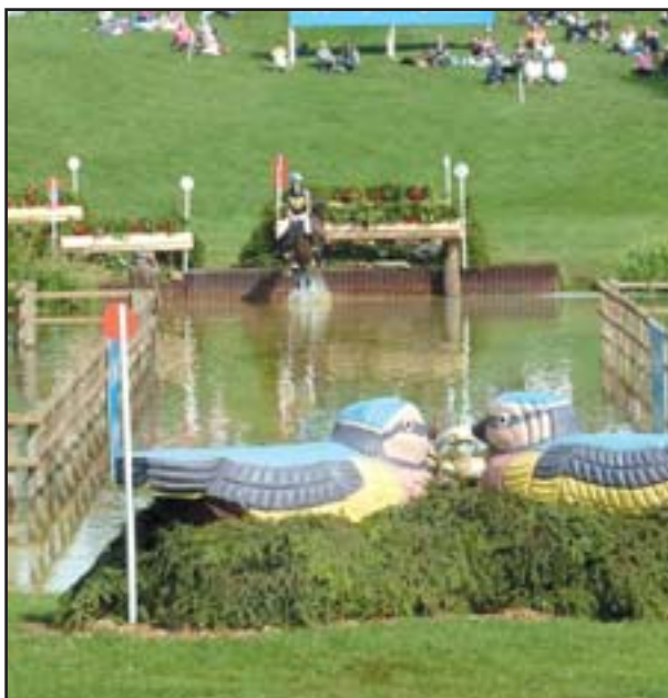
Divácká popularita Blenheimu odpovídá proslulosti závodu i místa konání a stavitelé trati si dávají záležet na každé překážce