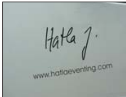
Jaroslav Hatla má kamion ozdoben svým jménem

Čtyř a pětiletým koním jsou navíc určeny