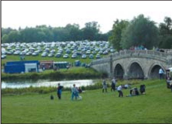
Starobylé prostředí zámeckého parku v Blenheimu senzačně dotváří atmosféru závodů, kterých se každoročně zúčastňují zástupy diváků

práci bude i nadále pravidelně sledovat britský trenér Kennet Clawson. Doufám, že se přes zimu zbavíme všech zdravotních neduhů a jaro 2011 nás zastihne v dobré kondici. Naším cílem jsou i nadále OH v Londýně, ale vím, že cesta ještě nebude jednoduchá.