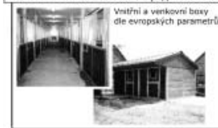
Vnitřní a venkovní boxy dle evropských parametrů