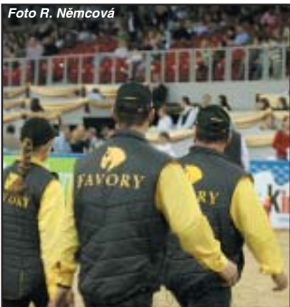
Starokladrubský chov prezentuje ve SP hřebčín Favory Benice