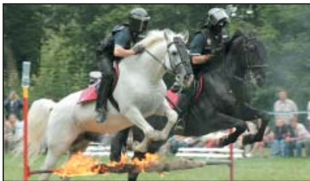
Při jezdeckém dni ve Slatiňanech 27. června vystoupila i mětská jízdnicí policie Ostrava, která má ve svých stájích starokladrubské vraníky

Děpoltovice 27.6. -ZM- děti 1. Hüttnerová - PRINCEZNA 9 (JS Gabriela), -ZM- 4 a 5 letí 1. rokem 1. Storkán - FINLANDIA