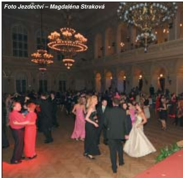
Galavečerní sezóna zahajuje