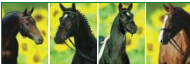
ROCKWELL CONTINUS GRANNUS SHOW STAR LIGHT ON