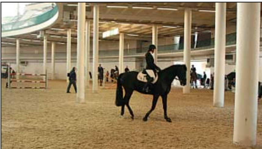
Opracoviště mezi sloupy