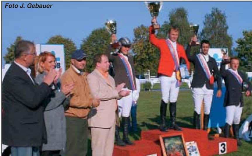
Stupně vítězů sedmého ročníku ČSOB Českého skokového poháru