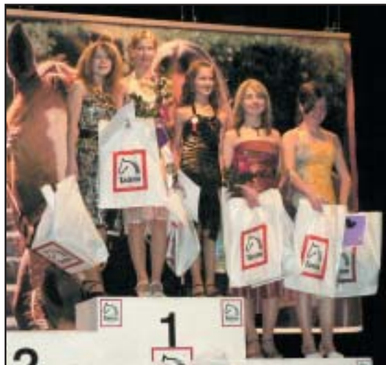
Nejlepší jezdkyňe kategorie všestrannost

Text + foto: Jan Matuška, foto R. Urbančíková