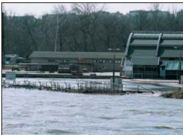
Zaplavené kolbiště JS Císařský ostrov

Pořadatelé společnosti In Expo Group na jednání v pondělí 3. dubna získali z povodí Vltavy prognózu, podle které by se měla povodňová situace uklidnit v rozmezí 5-7 dní. Tzn. pokud se tato prognóza vyplní, bude Jezdecká společnost Císařský ostrov schopna začít normálně fungovat o víkend 8. - 9. dubna. V tom případě všichni věří, že pořádání prvních českých halových CSI* ve dnech 14.-16. dubna, nebude nijak ohroženo. Doufat musíme i proto, že o účast na těchto závodech je zatím značný zájem. Pořadatelé, ještě před uzávěrkou, obdrželi přihlášky ze šesti zemí Evropy. Pokud vše dobře dopadne a voda dovolí, měli bychom na Císařském ostrově vidět o Velikonocích jezdce ze SRN, Polska, Slovenska, Itálie, Rakouska a Švýcarska.