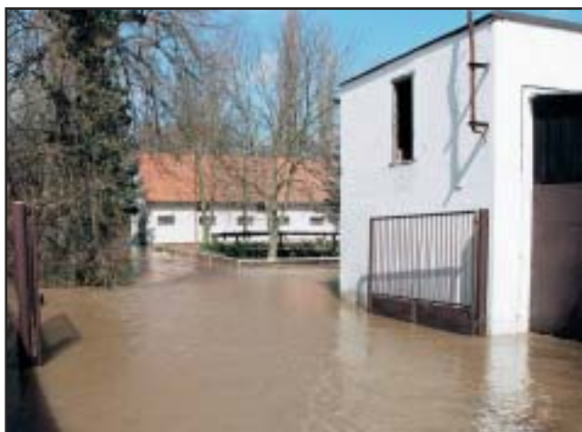
Jezdecký areál ve Staré Boleslavi