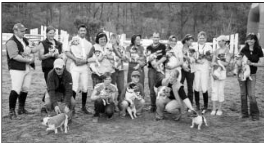
Společné foto účastníků první soutěže Jack Russellů v historii

Redakce zpravodaje Jezdec oznamuje, že již přestala používat e-mailovou adresu s příponou mbox. V současnosti používáme již pouze adresu jezdec@jezdec.cz