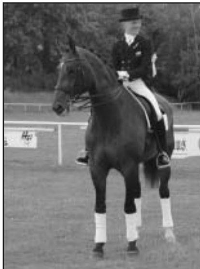
Nominovanými v kategorii C a D jsou i F. Sigismondí a DANCER

Pro ty z vás, kteří by ještě chtěli ovlivnit pořadí ankety o Koně a Jezdce roku 2004 znovu uvádíme pod jakými kombinacemi písmenek a čísel se skrývají jezdci a koně nominovaní skokovou komisí ČJF: