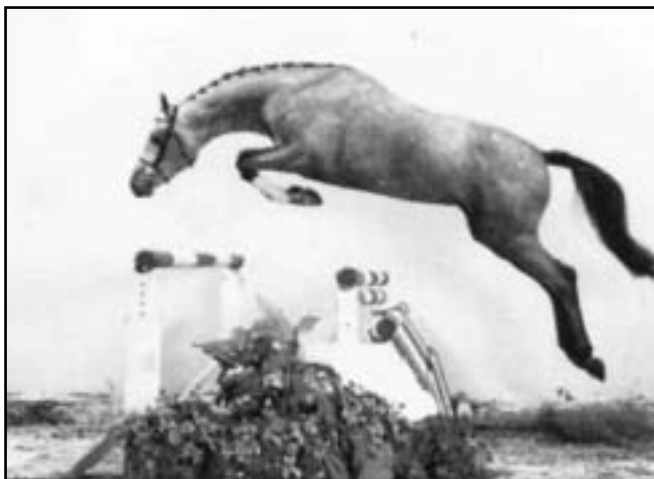
Novými akvizicemi společnosti ERC jsou hřebci CORRADO II a EDMINTON (dole)