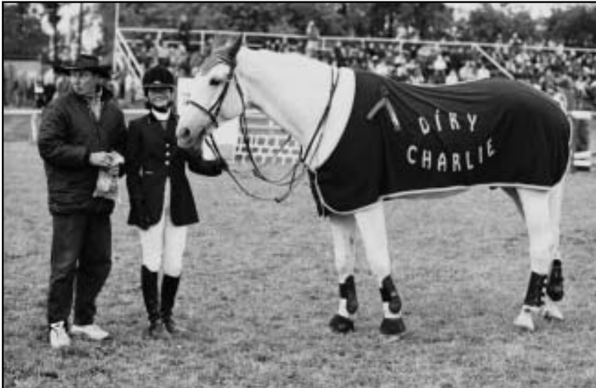
Se sportovní kariérou se v Opavě rozloučil bělouš CHARLIE, který sportovně proslavil jak otce, tak dceru Višinkovy