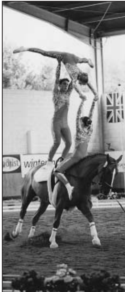
Voltížní cvičenci startovali na posledních Světových hrách v Rimě za ČR jako jediní. Naši vlajku ponosou pravděpodobně opět sami v Jerez de la Frontera

J. Pecháček: (vedoucí skokového SCM Nová Amerika) Ve Sportovním centru mládeže na Nové Americe jsme se s mojí skupinou sešli na konci roku 2001 třikrát. V říjnu, listopadu a prosinci přičemž říjnové posezonní soustředění bylo hodnotící, teoretické a bez koní. Naopak prosincové setkání bylo desetidenní. V roce 2002 jsou plánována čtyři setkání. První skončilo v neděli 20. ledna a bylo čtyřdenní. Další jsou plánována na únor, březen a duben a budou vždy čtyřdenní. V současnosti má moje skupina 20 členů a každý jezdec má dva koně. Pro zahraniční výjezdy se rýsuji velmi dobré možnosti v Sasku a doufám, že se opět uskuteční zájezd do Seelitz, stejně jako na již nám známé juniorské