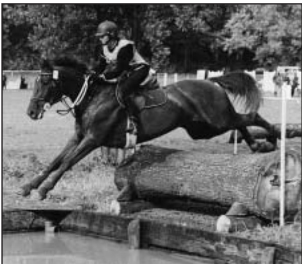
I. Konečná a SYMPATICA nenašly v ZP podvokrát přemožitele -běl-

● V Žadlovickém zámeckém parku pořádalo ve dnech 22.-24. června SOUz Loštice čtvrtou letošní kvalifikaci pro finále soutěží Zlaté podkovy. Jako jediní přijali letos loštici pořadatelé náročný úkol organizace sedlových a zářpáňových disciplín. Po slabších startovních polích při soutěžích ve Dvorečku a Šumperku byli pořadatelé v Lošticích překvapeni počty přihlášených jezdců a koní. V sedlových disciplínách startovalo celkem 74 dvojic a ve spřežených devět párů a šest jednosprežů.