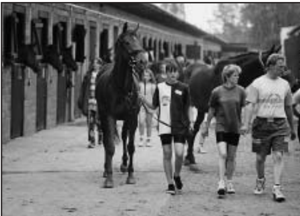
Pardubické závodíště disponuje dobrým zázemím pro koně

ná, ale nakonec hladký průběh prokázal, že naše militaristická špička je již na takovou úroveň připravena.