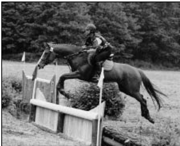
Domácí jezdec z JK Loštice startoval ve Stříbrné podkově i s klisnou JESSY