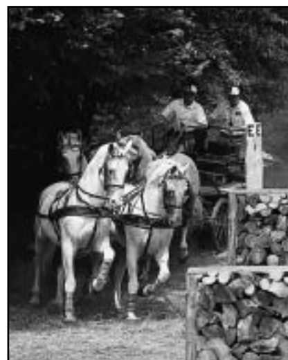
Nejlepší v čtyřspreží byl tradičně domácí P. Vozáb