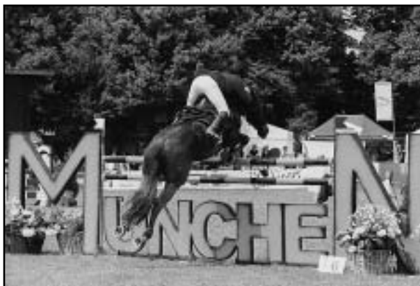
Poslední skok v rozeskakování Velké ceny zabránil ještě větší sportovní senzací

V dobrých výkonech pak pokračovali i CARDINAL a CONTENDER. Druhý jmenovaný dokázal být se 4 tr. body ve finále Audi cup mladých koní čtrnáctý.