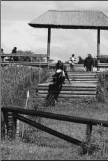
Při CCI byla představena další nová překážka

telů již nemá nikdo pochyb a protože našťastí v týdnu před soutěží i trochu zapršelo, byly podmínky pro soutěž skoro ideální. Krásné prostředí, slušný povrch, zahraniční konkurence, žádná vážnější zranění na trati, nový skok v crosu, česká vítězka. Co víc si lze přát.