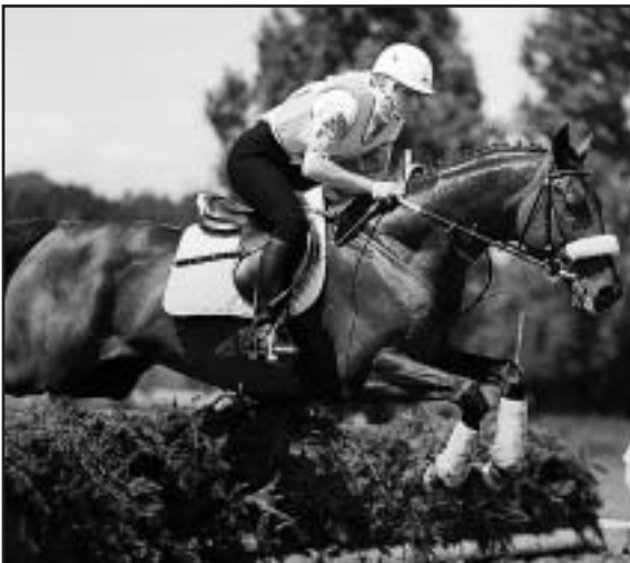
Přes obtížný terén byla sobotní terénní zkouška pro VAŽEC N. Knopové procházka

v pořádku, i po deštivém měsíci jehož srážky absorbovalo závodistiště jen stěží, kdyby nepřišla v předvečer soutěže výrazná bouřka. A tak i letos bylo organizátorům úzko. Drezúrní zkouška se konala za deště a přes skutečnost, že se na sobotní krajinové jízdě krásně vyčáslilo nebyl terén v Humpolci ani tentokrát vůbec snadný. Kvůli měkké půdě pak museli organizátoři na poslední chvíli vypustit i jeden ze skoků steeple chasy a u dalšího zúžit průčelí. Nakonec ale vše dobře dopadlo, i když většina koní musela sáhnout až na dno svých sil.