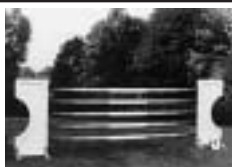
Překážky + příslušenství (lišty, háky, bariéry)

EKVITAN PLZEŇ s.r.o. Jasná 4, 312 08 Plzeň Tel./fax: 019/600 79