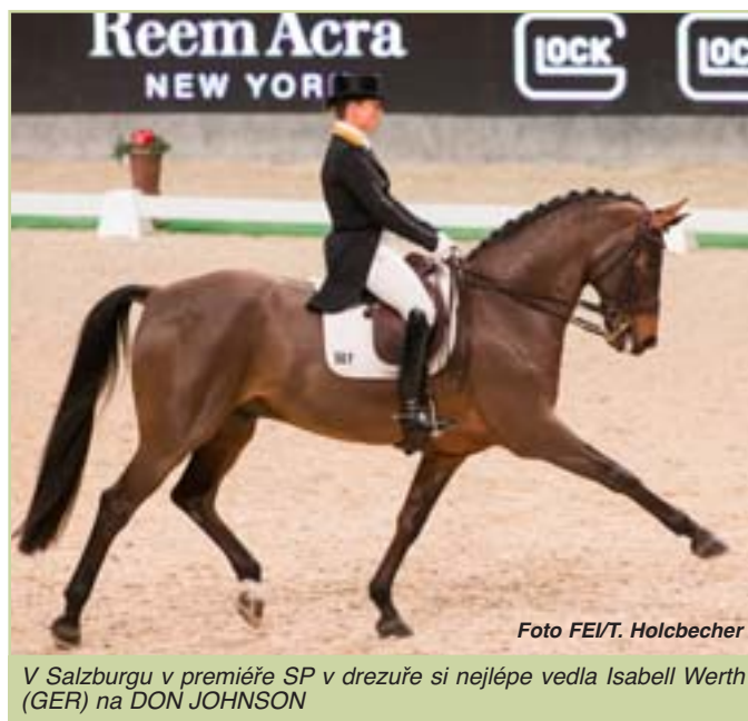
V Salzburgu v premiéře SP v drezuře si nejlépe vedla Isabell Werth (GER) na DON JOHNSON