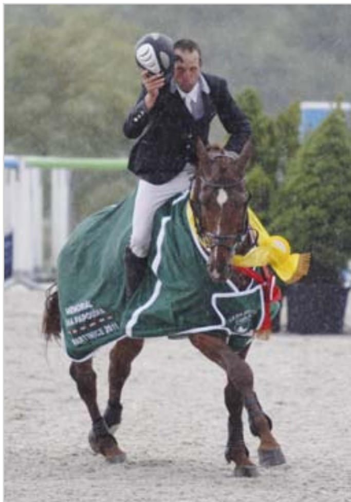
Mnohokrát se potvrdilo, že v Martinicích se dá soutěžit i za velmi nepříznivého počasí

prostředků. Například na velké výsledkové tabule, na kvalitnější skokový materiál, na zahraniční stavitele. Nebo i na to, abychom nemuseli, z čistě ekonomických důvodů tolik navyšovat počty startů. Zbylo by více prostoru pro programovou show, která by možná zvýšila diváckou atraktivitu jinak poměrně monotónních jezdeckých závodů.