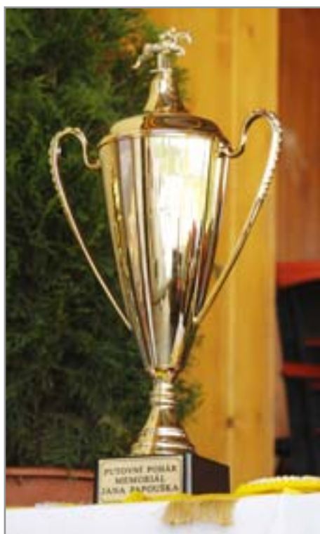
PŮVODNÍ POKÁL MEMORIÁL JANA PAPOUŠKA

prostředků. Například na velké výsledkové tabule, na kvalitnější skokový materiál, na zahraniční stavitele. Nebo i na to, abychom nemuseli, z čistě ekonomických důvodů tolik navyšovat počty startů. Zbylo by více prostoru pro programovou show, která by možná zvýšila diváckou atraktivitu jinak poměrně monotónních jezdeckých závodů.