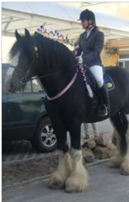
V letošním kaleidoskopu plemen nechyběli opět zástupci největších koní světa plemene shire horse