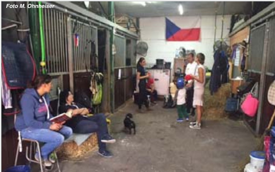
Česká stáj v Barceloně

sobotního finále. Zbývajících jedenáct, s výsledky Katar, Mexiko a Brazílie – 16, Austrálie a Egypt – 20, Itálie – 21, Česká republika – 23, Francie 24, Venezuela – 43 a Polsko spolu se Španělskem – 46, se utkalo v pátečním malém finále Longines Challenge Cup