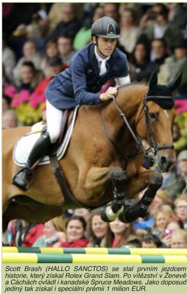
Scott Brash (HALLO SANCTOS) se stal prvním jezdcem historie, který získal Rolex Grand Slam. Po vítězství v Ženevě a Cáchách ovládl i kanadské Spruce Meadows. Jako doposud jediný tak získal i speciální prémii 1 milion EUR.

Devětadvacetiletý Brit je prvním jezdcem v historii, který dokázal vyhrát v řadě za sebou tři součásti jezdeckého Grand Slamu. Triumfoval na halovém CHI v Ženevě, ovládl Velkou cenu v Cáchách a nyní zvítězil ve Spruce Meadows