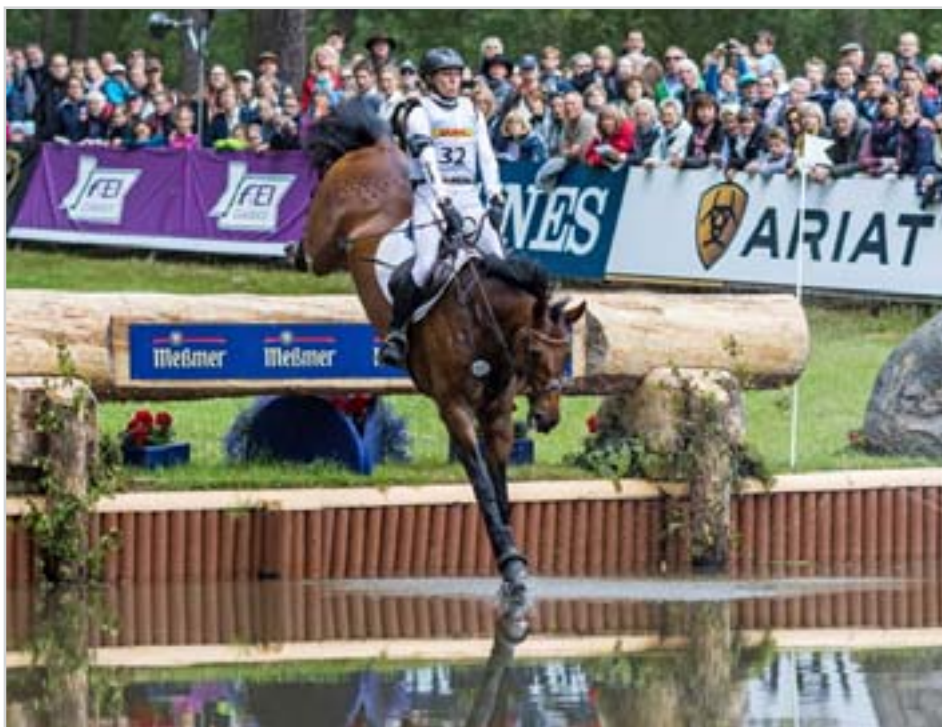
Německá militaristka Ingrid Klimke zvítězila na ESCADA při CCI4* v Luhmühlenu (18. - 21. června) a zvýšila tak svůj náskok v seriálu FEI Classics 2014/2015. Před závěrečným závodem (Burghley Horse Trials, 3. - 6. září) vede po pěti kolech s jasným náskokem 17 bodů před Michaellem Jungem (GER). Na třetím místě je o pouhé dva body William Fox-Pitt (GBR). Kompletní výsledky naleznete na www.luhmuehlen.de