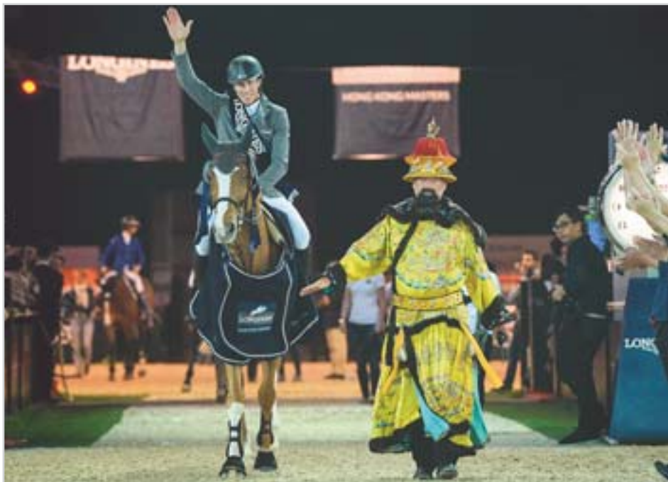
Henrik von Eckermann a GOTHA FRH zvítězili v Hong Kongu v Gucci Trophy

Výborný byl Maikel van der Vleuten s 15letou bělkou VDL GROEP SAPHIRE B (Mr. Blue). Projel trasou velmi razantně a o osm desetin se ujal vedení. O to ho však připravil hned následující 20letý belgický mladík Nicola Philippaerts s 11letou ryzkou DONATELLA-N (Vigo d'Arsoilles), který byl ještě o dvě desetiny rychlejší. Jeho otec Ludo Philippaerts v hledišti skákal nadšením, s oslavami však musel chvíli počkat. Na startu byli ještě dva skvělí jezdci.