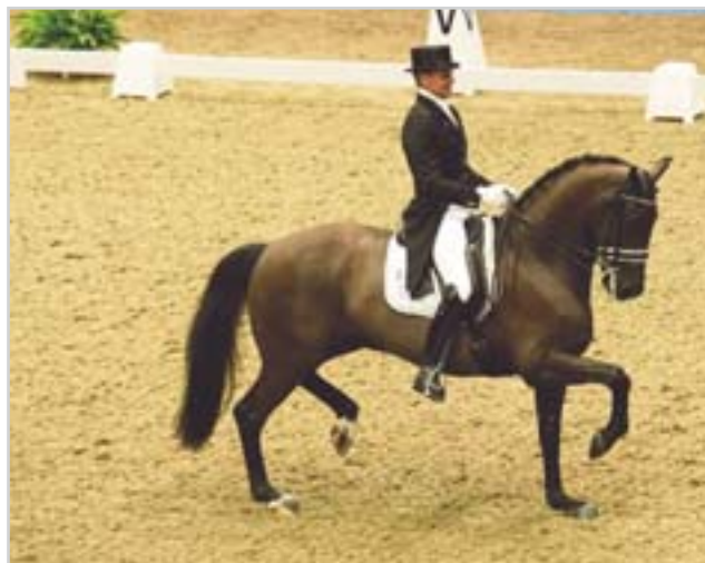
Edward Gal na GLOCK'S UNDERCOVER byl pro domácí Dujardin jediným konkurentem

Podrobnosti z Londýna jsou na www.olympiahorseshow.com Další kolo drezurního Světového poháru bude v sobotu 25. ledna 2014 v Amsterodamu.