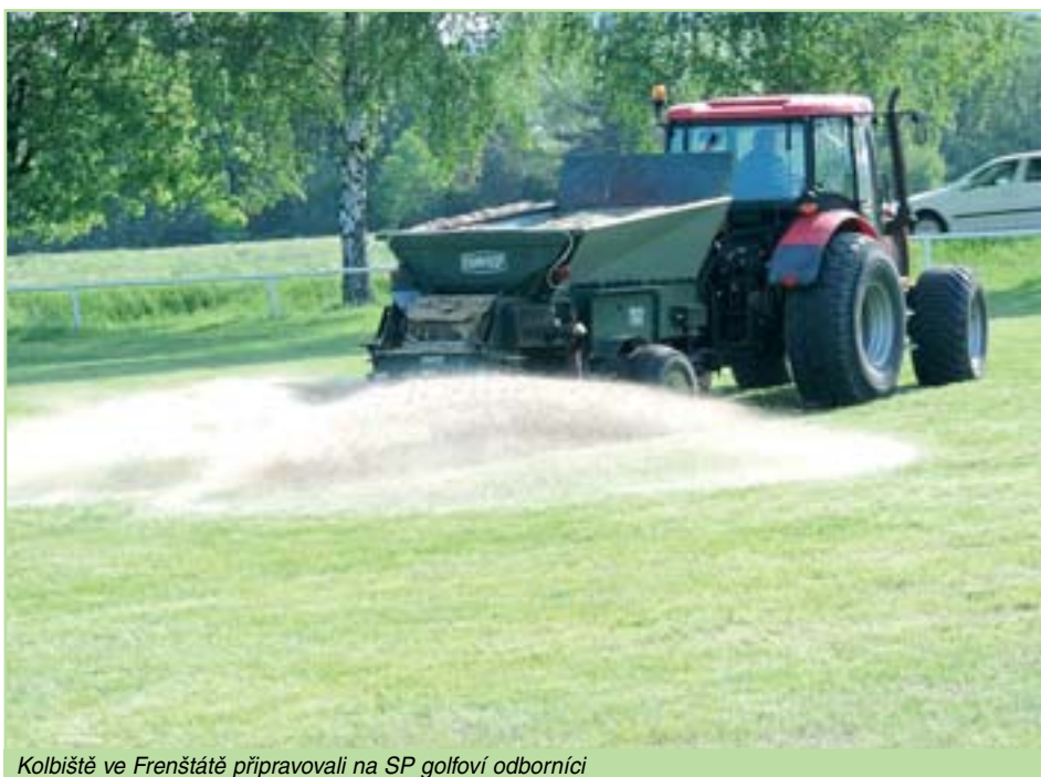
Kolbiště ve Frenštátě připravovali na SP golfoví odborníci

XVII. ročník soutěže dívek Amazonka se konal v Kolíně 30. června. Mezi 43 startujícími zvítězila v soutěži -S* po rozeskakování 13 dvojic Michaela Hažmuková na CAPRIANO (JK Dance and Jump)