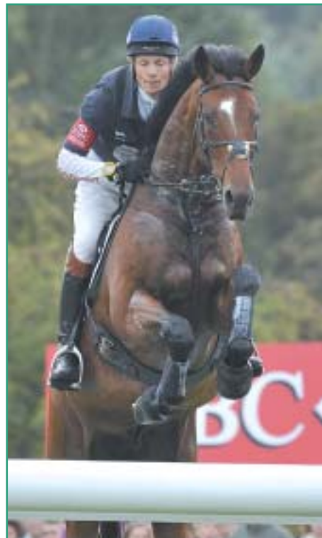
Současný lídr světového žebříčku HSBC ve všestrannosti William Fox-Pitt (GB - na fotu s Parkane Hawk při loňském Land Rover Horse Trials v Burghley) bude ve dnech 26. - 29. dubna startovat i ve třetím kole seriálu HSBC FEI Classics, které se koná v Kentucky. Fox-Pitt vede žebříček o 59 bodů před Andrew Nicholsonem (USA). Dá se tedy předpokládat, že v Kentucky bude sveden boj nejen o body do seriálové soutěže HSBC FEI Classics, ale i o čelo světového žebříčku. Připomeňme ještě, že společnost HSBC věnuje vítězi žebříčku na konci sezóny prémii 50 000 USD. Vloni si tento příjemný obnos odnesla Mary King (USA), která je však letos zatím na 10. pozici.