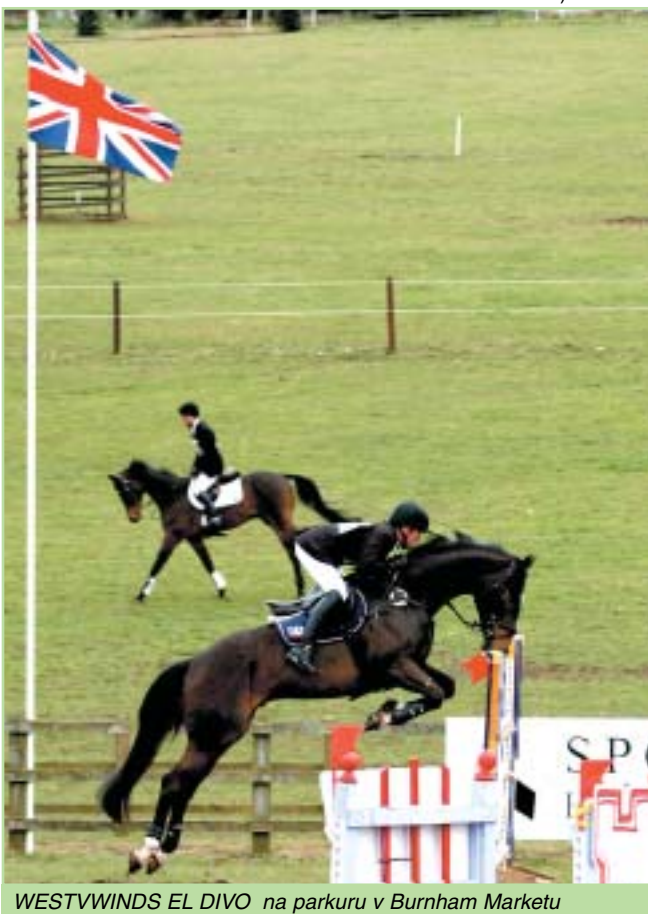
WESTVWINDS EL DIVO na parkuru v Burnham Marketu

Finále pony bude při MČR ve Zduchovicích 16.-19. 8. a pro koně 28.-30.9. v Hořovicích.